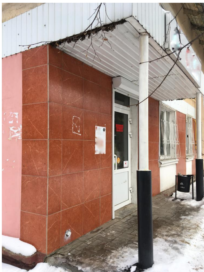
Сохранившиеся стенные геодезические пункты